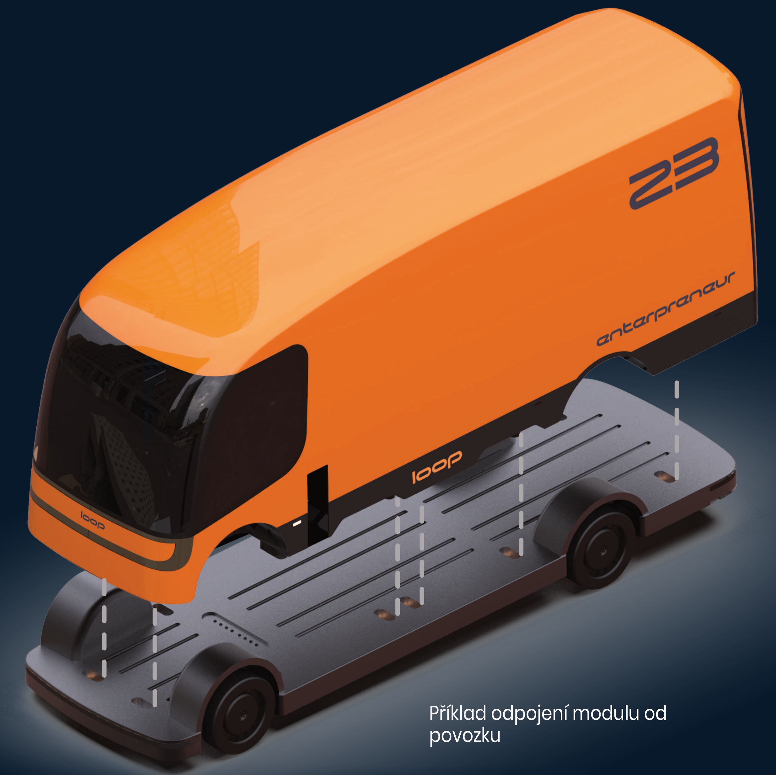
Příklad odpojení modulu od povozku