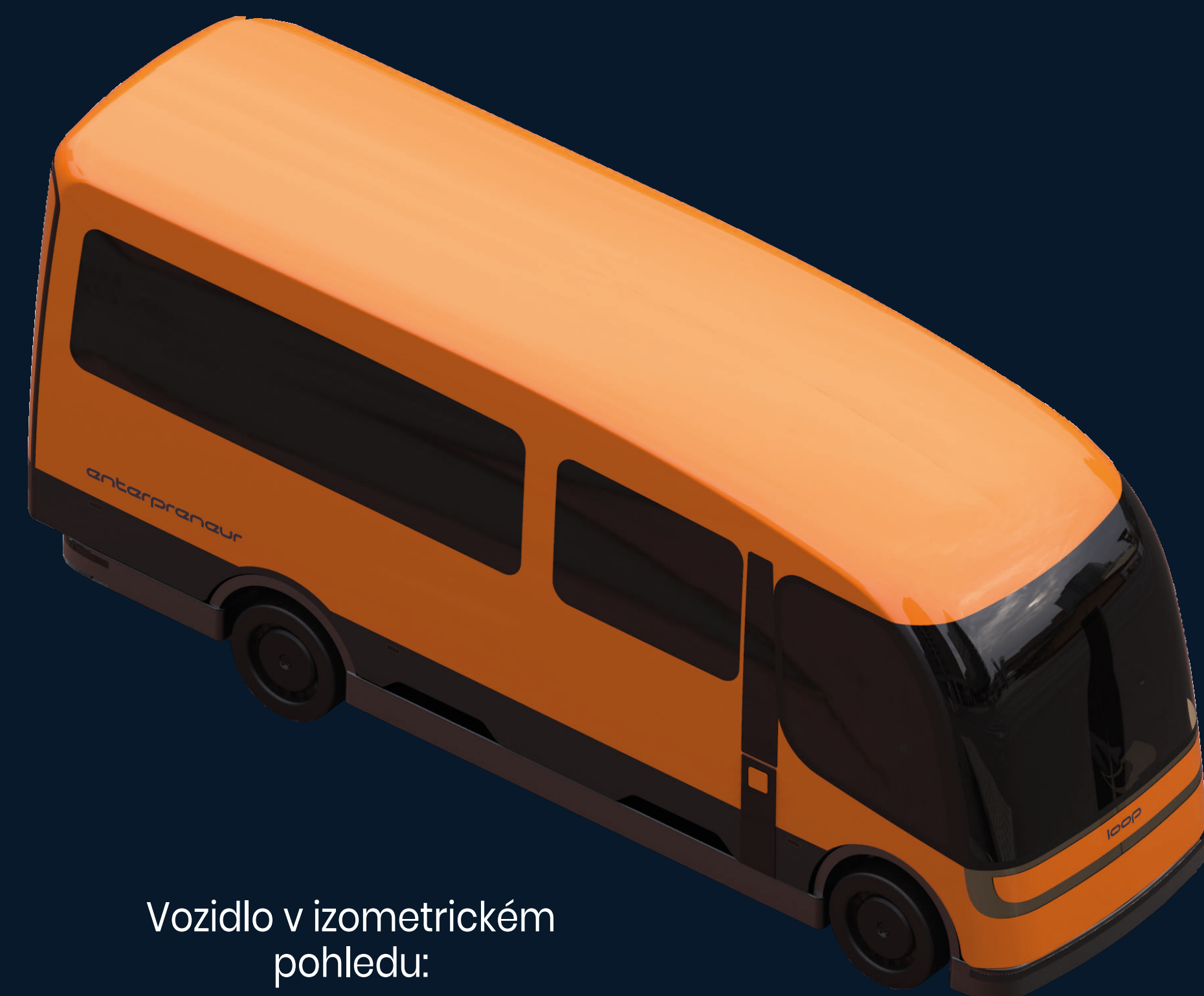
Vozidlo v izometrickém pohledu:

Projekt cílí na rozvoj tzv. „sdílených platforem“ - truck-sharingu. Jedním z vytyčených parametrů analýzy bylo usnadnit výměnu modulů - návrh by tento proces měl snížit do několika minut, mělo by jít o čistý bezkontaktní proces.